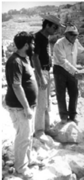
Alon, Šilo, a Mazar

Ezechiášov tunel, čiže rukou vykopaný vodný tunel, ktorý je dlhý 530 metrov, bol objavený v roku 1838 Edwardom Robinsonom, ďalším britským archeológom.