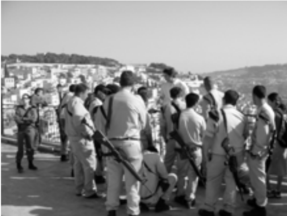
Vojaci na turistickej prehliadke.