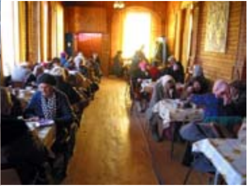
Jedáleň v Berdičeve

Predkladáme vám tiež modlitebné potreby: