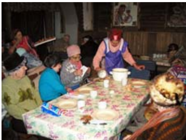
jedalen v Žitomiri – miesto kde začala cela práca

Ďakujeme vám za modlitby a finančné príspevky. Nech Pán rozmnoží svoje požehnane na každom z vás!