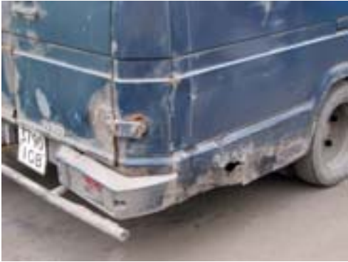
Auto, ktoré sa úplne rozpadáva, a ktoré má najjazdených viac ako 1,5 mil. km.