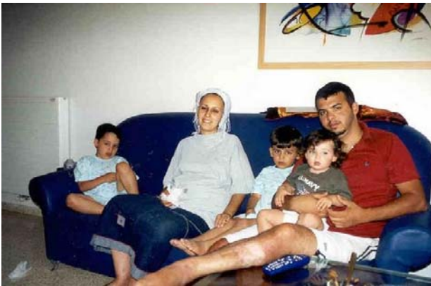
Roni s manželkou Širou a svojimi deťmi

"Š'ma Israel Adonai Eloheinu, Adonai Echad!" (Počuj Izraelu, Hospodin, tvoj Boh je Jeden!)