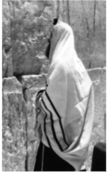
Modlitebný šál sa používa ako modlitebná komôrka.

Nosenie týchto strapcov by sa mohlo prirovnať k tomu, akoby sme nosili veľkú Bibliu na šnúrke okolo krku. Ako by sme sa správali pred ľuďmi, ako by sme sa rozprávali s druhými, kam by sme šli? Tým, že Boh prikázal Izraelcom nosiť tieto strapce, vlastne zamýšľal, aby im neustále pripomínali Jeho Slovo.