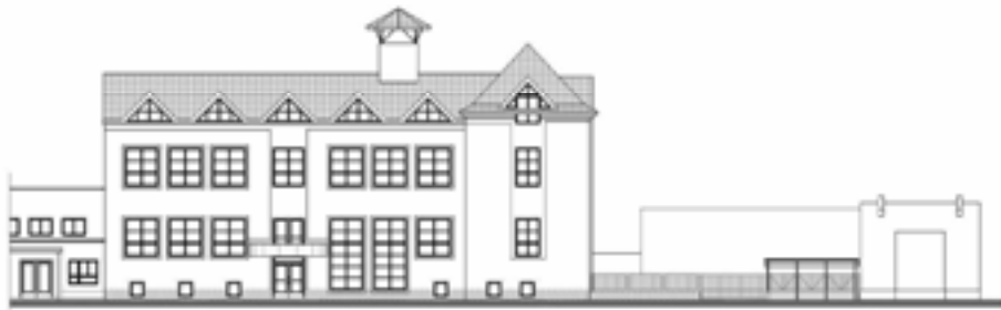
Pohľad na projekt budovy po rekonštrukcii.

Budova potrebuje rekonštrukciu. Návrh a príprava projektu, materiál a samotná práca na stavbe stojí veľmi veľa. Je to obrovský projekt, ale Boh Izraelov, ktorý je náš Otec a Boh je oveľa väčší, než tento projekt. Táto vízia je nielen pre tím Chevra, ale aj pre tých v tele Ješuu (Ježiša), ktorých srdcia sú zlomené pre Židov, a ktorí chcú byť Jeho požehnaním pre nich: “A požehnám tých, ktorí ňa žehnajú” (1 M. 12:3)