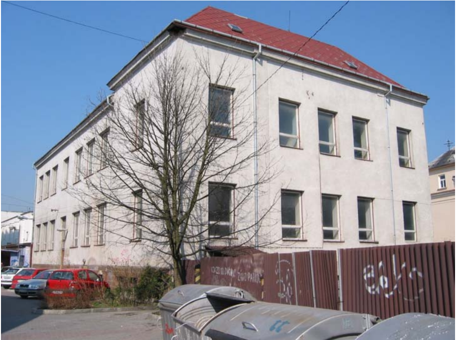
Súčasný stav budovy