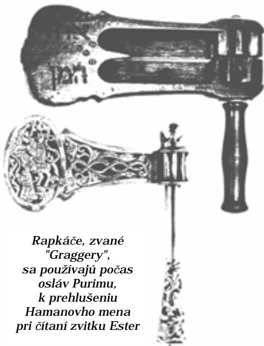
Rapkáče, zvané "Graggery", sa používajú počas osláv Purimu, k prehlušeniu Hámánovho mena pri čítaní zvitku Ester

Oslava Purimu je známa svojimi hrami a paródiami. Dnes sa v Izraeli na Purim zvyknú robiť tiež spoločenské večierky a sprievody. Ulice sú plné ľudí, hlavne detí. Sú oblečené v rôznych kostýmoch. Takmer vo všetkých uliciach v centre Jeruzalema, v skutočnej karnevalovej atmosfére, môžeme vidieť malé princezné Estery a malých Mardocheov. Pobehuje tam dokonca aj niekoľko zlých Hámánov, zvyčajne vypískavaných a vysmievaných davom. Samozrejme kostýmy nie sú limitované iba inšpiráciami z knihy Ester, ale nájdeme tam tiež klaunov, kozmonautov, kovbojov a tiež veľa ďalších, aj zahraničných výtvorov