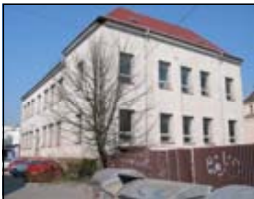
Súčasný stav budovy