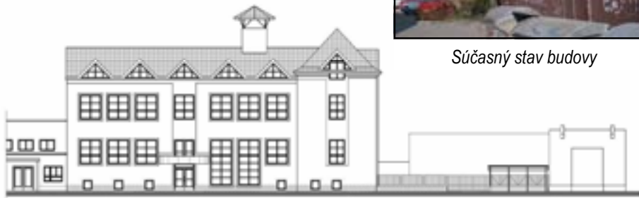
Pohľad na projekt budovy po rekonštrukcii.

Preto vás vyzývame k modlitbám, aby Pán oslávil svoje meno v projekte prestavby budovy, cez ktorú budeme môcť vo väčšej miere naplňovať projekty pomoci, osvety a vzdelávania a oslavovať tak Jeho Meno. Je to mimoriadne veľký projekt, ale Boh Izraelov, ktorý je náš Otec a Boh je oveľa väčší, než tento projekt. Táto vízia je nielen pre tím Chevra, ale aj pre tých v tele Ješuu (Ježiša), ktorých srdcia sú zlomené pre Židov, a ktorí chcú byť Jeho požehnaním pre nich: “A požehnám tých, ktorí ňa žehnajú” (1 M. 12:3).