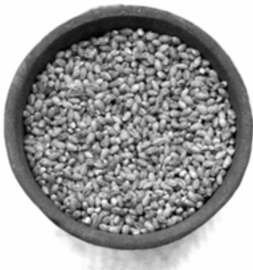
Zber jačmeňa je prvý z rady žatiev a znamená sviatku Šavuót.

A tak prvotné obete jačmeňa Prvotín žatvy sú znakom prichádzajúcej žatvy, a pšeničné obete Šavuótu poukazujú na to, že toto zasľúbenie sa začína naplňať. Šavuót tiež prináša široký výber skorého jarného ovocia, ktoré dozrieva v tomto období. Toto