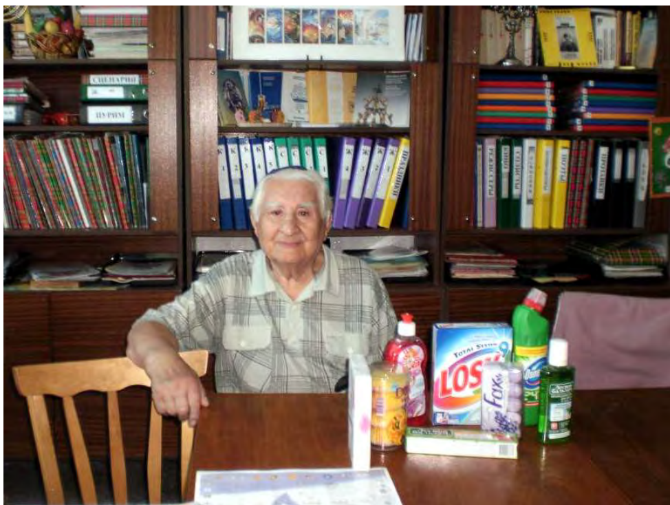
Cal pri preberaní hygienických vecí v kancelárii v Korsuni.

Informácie o účtoch nájdete na predposlednej strane časopisu alebo na www.chevra.sk . Použite var. symbol „777“ s textom LIEKY. Ďakujeme. Chevra tím