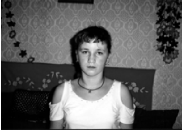
Marianna chorá na srdce

Cestujúc do dedinky Vilok na Ukrajinsko-Maďarských hraniciach, spomenul som si na jej prvú návštevu.