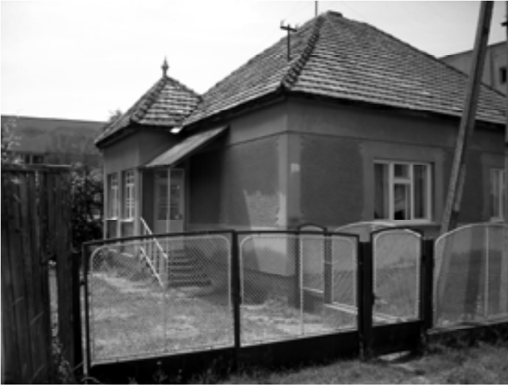
Dom, v ktorom bývajú.

Pre praktickú pomoc tejto rodine sú potrebné financie na: