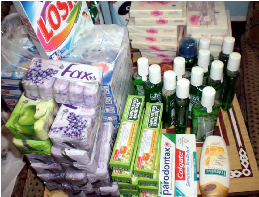
Nákup základných hygienických potrieb.