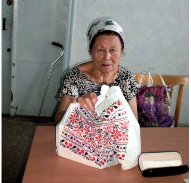
Pri preberaní hygienických vecí v kancelárii v Korsuni.