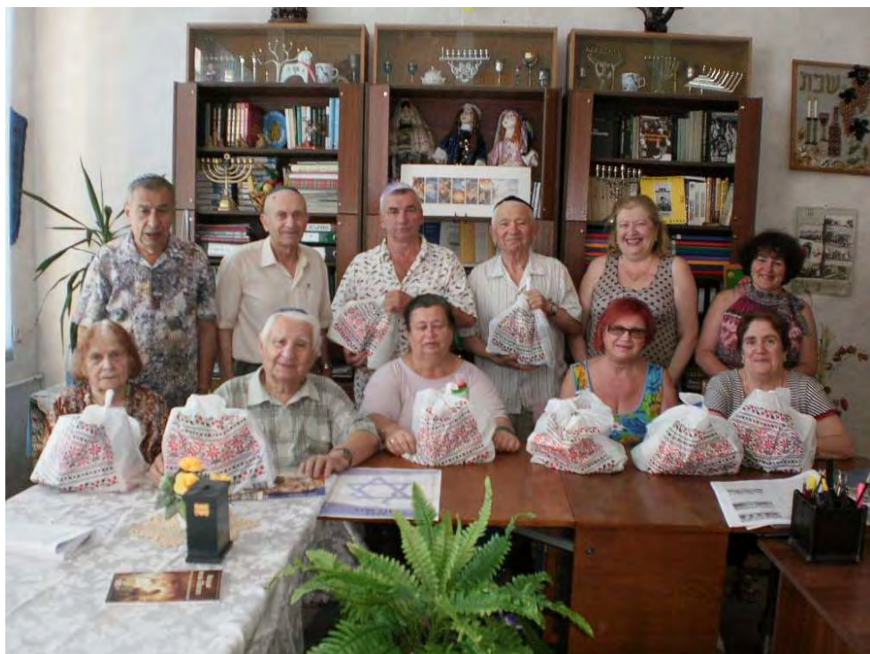
Pri preberaní hygienických vecí v kancelárii v Korsuni.

Informácie o účtoch nájdete na predposlednej strane časopisu alebo na www.chevra.sk . Použite var. symbol „777“ s textom LIEKY. Ďakujeme. Chevra tím