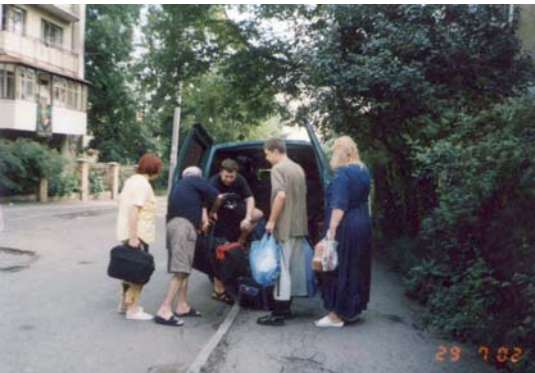
Posledné tašky, rozlúčka s priateľmi a dlhá cesta do Odesy.

Nie je ľahké opustiť domov (i keď je to biedna krajina), zanechať svojich blízkych, svoje zamestnanie, svoj byt alebo dom, zvyky a kultúru, opustiť to, čo poznajú a vydať sa do neznáma - do krajiny, ktorá je tak iná. Musia sa naučiť jazyk, nájsť si byt a prácu, zorientovať sa, vybaviť všetky doklady a začať žiť. Je to ťažké - najmä pre starých ľudí. Mladí sa rýchlo prispôbia, nájdu si prácu, alebo študujú. Jazyk je pre nich prekážkou len chvíľu - po niekoľkých mesačných kurzoch