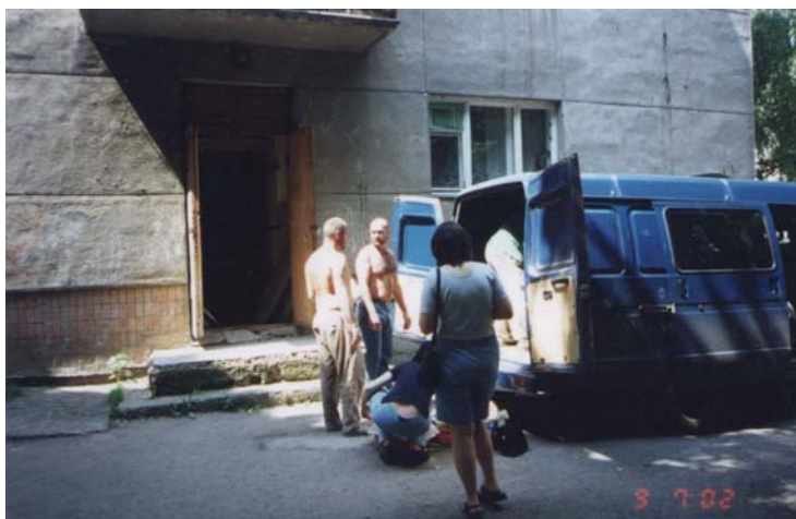
Rozvoz potravinových balíkov

Rozprávala som sa s viac než 100 ľuďmi židovskej národnosti. Počúvať ich životné príbehy bolo ako ponoriť sa do ich trpkkej, pre nás nepoznanej minulosti, akoby som listovala v kalendári minulosti a videla všetko to zverstvo a násilie páchané na židoch. Ľudia, ktorí o tom môžu dnes podať svedectvo, len zázrakom prežili koncentračné tábory, getá, gulaky, evakuácie. Videli svojich blízkych - umučených, rozstrieľaných, spálených... . Niektorí z nich sa už do minulosti nechcú vracieť. Spomienky na ňu im spôsobujú bolesti, otvárajú rany, ktoré nemôže zahojiť človek. Chcú zabudnúť a v pokoji dožiť - no nemôžu. Denne zápasia o prežitie. Cez pravidelné zásielky potravín, dovoz uhlia v zime, možnosti stravovania v jedálňach, a inú pomoc, prežívajú "Boží dotyk". Zaiste vedia, že Boh na nich nezabudol. Dnes sa už môžu mať lepšie vďaka projektom ktoré financujú ľudia, ktorí sa rozhodli priložiť svoju ruku k dielu, ktoré Boh koná