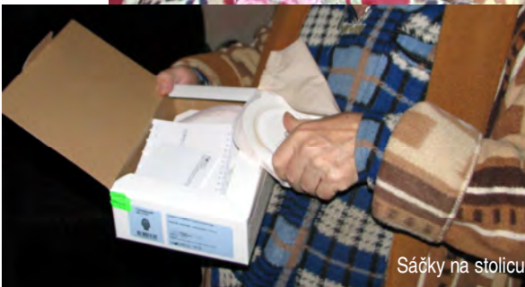
Sáčky na stolicu