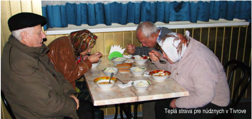
Teplá strava pre núdnych v Tivrove

zomrela na rakovinu. Je úplne odkázaný na pomoc druhých. Z Gnivy vyrážame do Tivrova, kde je zriadená jedáleň. Obedy sa podávajú päťkrát týždenne.