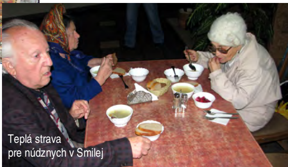
Teplá strava pre núdznych v Smilej

sme cestovali do Smilej, kde v jednej z reštaurácií zabezpečuje Chevra obedy trikrát týždenne, pričom štyrom ľuďom sa obedy distribujú priamo do domu.