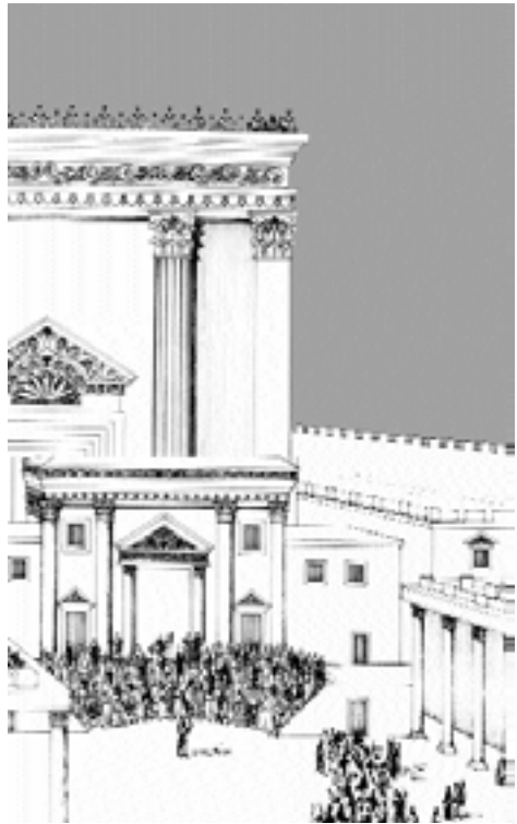
Pútnici prichádzajú oslavovať do Jeruzalema

Jeruzalem bol hlavným cieľom životných pútí zbožných mužov a žien viery po 3000 rokov. Mnohí pútnici nasledovali Boží príkaz “vystúpiť hore” do Jeruzalema na oslavy biblických sviatkov. Je rozhodujúce to, že On im pripomína cez rituály sviatkov, čo pre nich (a pre nás) v priebehu histórie urobil.