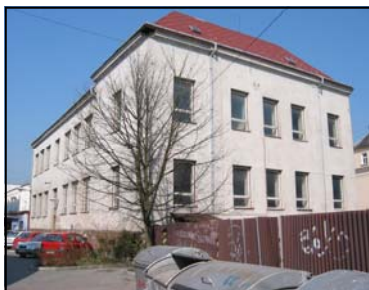
Súčasný stav budovy

Budova potrebuje rekonštrukciu. Návrh a príprava projektu, materiál a samotná práca na stavbe stojí veľa. Je to mimoriadne veľký projekt, ale Boh Izraelov, ktorý je náš Otec a Boh je oveľa väčší, než tento projekt. Táto vízia je nielen pre tím Chevra, ale aj pre tých v tele Ješuu (Ježiša), ktorých srdcia sú zlomené pre Židov, a ktorí chcú byť Jeho požehnaním pre nich: "A požehnám tých, ktorí ťa žehnajú" (1 M. 12:3). Ďakujeme vám za vaše príspevky.