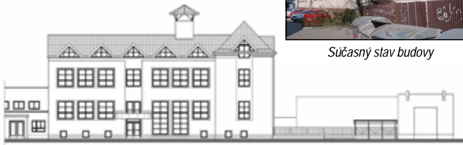
Pohľad na projekt budovy po rekonštrukcii.

Pre všetkých vás, ktorý ste sa rozhodli prispieť na projekt CHEVRA CENTRUM sú nasledovné informácie: