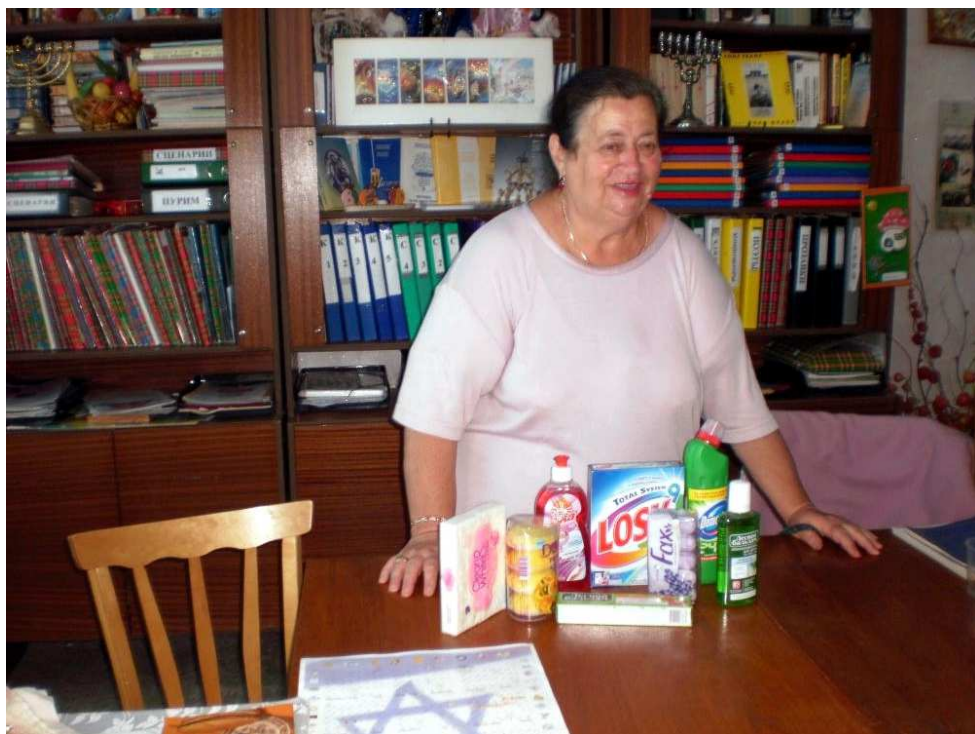
Pri preberaní hygienických vecí v kancelárii v Korsuni.

Informácie o účtoch nájdete na predposlednej strane časopisu alebo na www.chevra.sk . Použite var. symbol „777“ s textom LIEKY. Ďakujeme. Chevra tím