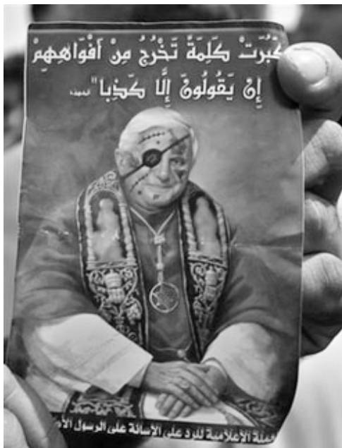
Odpověď na pápežov citát ...

Manuil II. Paleolog (1350-1425), byzantský imperátor.