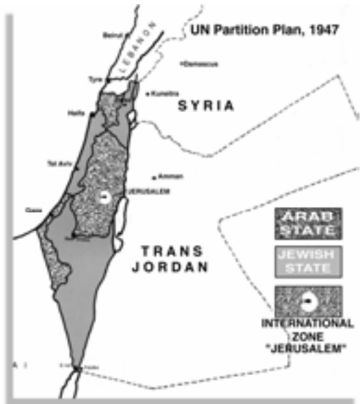
Mapka 4. OSN predstavila rozdelenie oblasti na arabský štát a židovský štát, pričom Jeruzalem sa mal stať medzinárodnou zónou. Palestínski Židia, túžiaci po nezávislosti, boli ochotní prijať kompromis – rozdelenie. Ale Arabi plán OSN bojkotovali.

Pre palestínskych Arabov zo západnej Palestíny znamenalo ich odmietnutie Plánu rozdelenia z r. 1947 a ich voľba vojny to, že stratili prvú z mnohých šancí na získanie národného domova – bola to strata kvôli ich taktike “všetko alebo nič.”