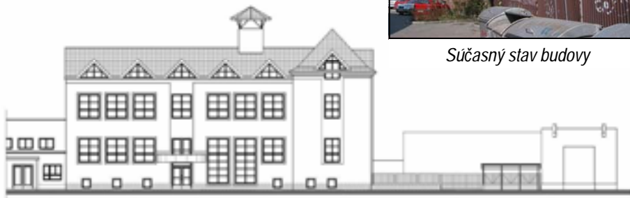
Pohľad na projekt budovy po rekonštrukcii.

Pre všetkých vás, ktorý ste sa rozhodli prispieť na projekt CHEVRA CENTRUM sú nasledovné informácie: