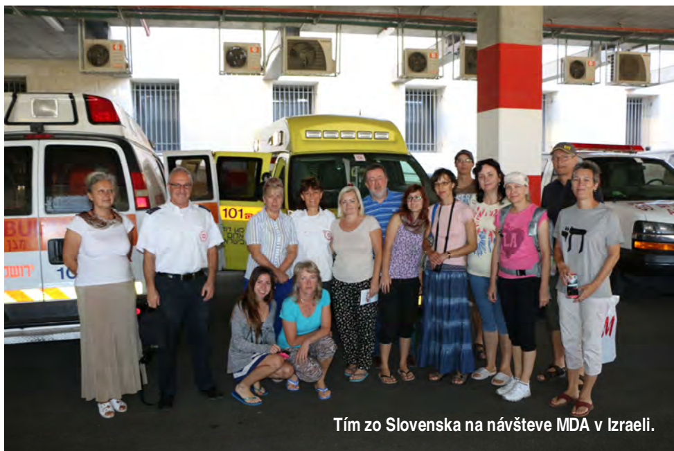
Tím zo Slovenska na návšteve MDA v Izraeli.

Niektorí ste sa pýtali, či projekt Ambulance (sanitka) pokračuje. Áno, samozrejme, pokračuje. Podľa izraelských zákonov sa sanitky môžu používať maximálne 8 rokov. Potom ich treba vymeniť za nové. Znamená to, že tieto potreby sú celý čas aktuálne a my naďalej pokračujeme v ich napĺňaní. Ľudský život, jeho ochrana a záchrana v ohrozujúcich situáciách, majú pre Židov nevyčísľiteľnú hodnotu. Boh i v Tóre venuje životu zvlášť pozornosť, lebo je stvorený samotným Stvoriteľom. Preto tvoj dar neprejde pred Otcom nepovšimnutý!