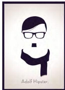
Internetová ikona spájaná s Hitlerom

Al-Husseiniho snahy v prospech nacistov počas druhej svetovej vojny neboli zadarmo. Býval v Paríži a bol na Hitlerovej výplatnej listine ako