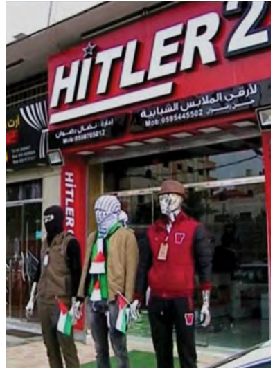
Malooobchodná predajňa v Gaze mávajúca s nožmi na figúrach

Brian Schrauger Dispatch 2016 Bridges for Peace