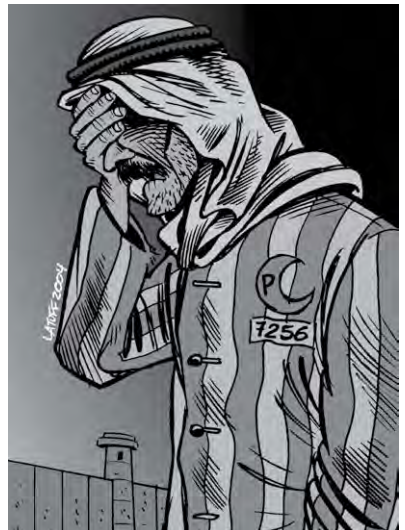
Karikatúra porovnáva súčasné životné podmienky v Gaze, Judei a Samárii s Holokaustom