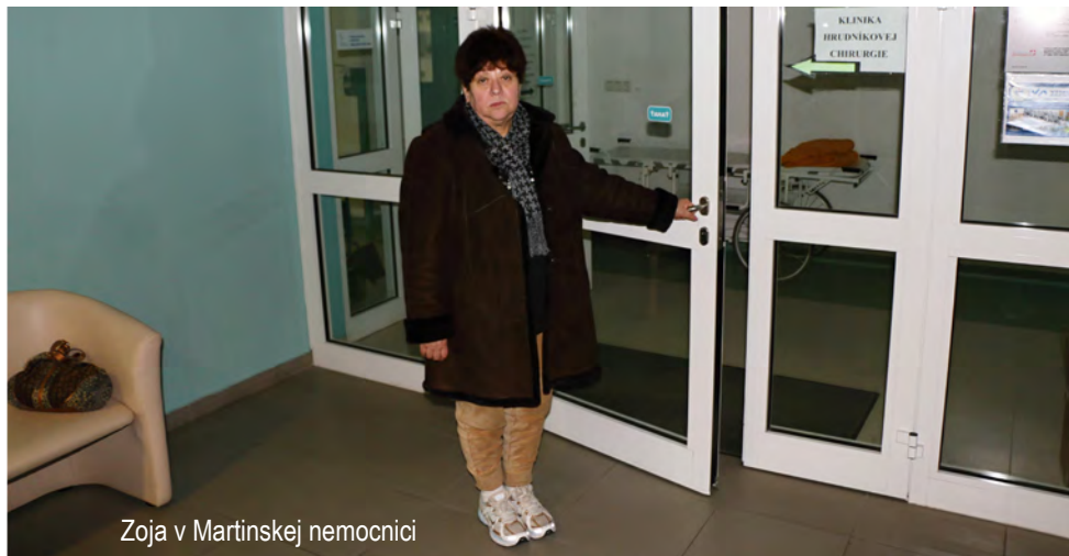
Zoja v Martinskej nemocnici