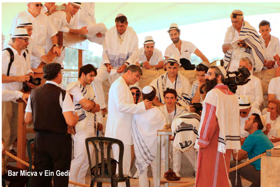
Bar Mícva v Ein Gedi

Ďakujem za každý prežitý moment na miestach, kadiaľ môj učiteľ chodil, prijímať Božie telo pri prázdnom Ježišovom hrobe, pohľad na Golgotu, modlitba v getsemanskej záhrade, plavba po Galilejskom jazere, kráčať po vlastných po Jeruzalemských hradbách...v centre celosvetového diania, naplnených prorociev, duchovných stretov so zaslúbením Božej prítomnosti uprostred svojho ľudu.