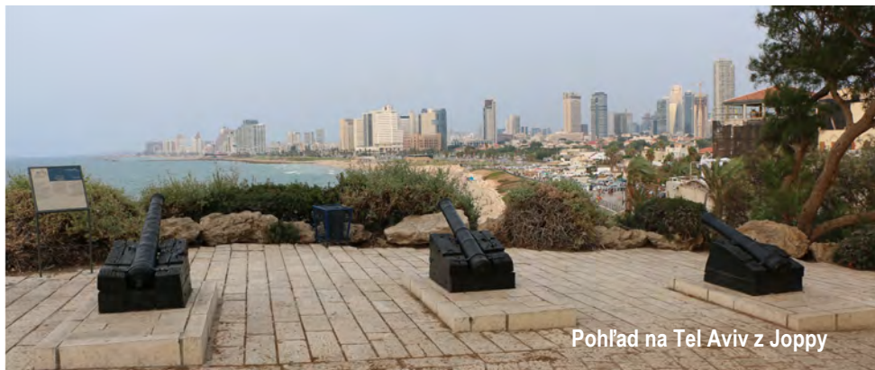
Pohľad na Tel Aviv z Joppy

106 rokov staré mesto, žije tu 0,5 mil. ľudí, spolu s predmestiami jeden milión a pol – tj. jedna štvrtina populácie. Jedna osmina sú rusi. Izrael má nelegálnych imigrantov bez dokladov, ktorí prišli cez Sinaj zo Súdánu, Eritrey, niektorí sú moslimovia, ktorí robia neporiadok.