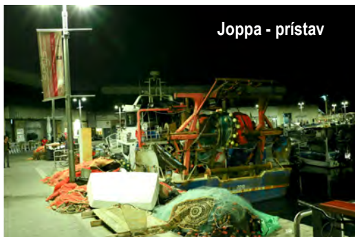
Joppa - prístav