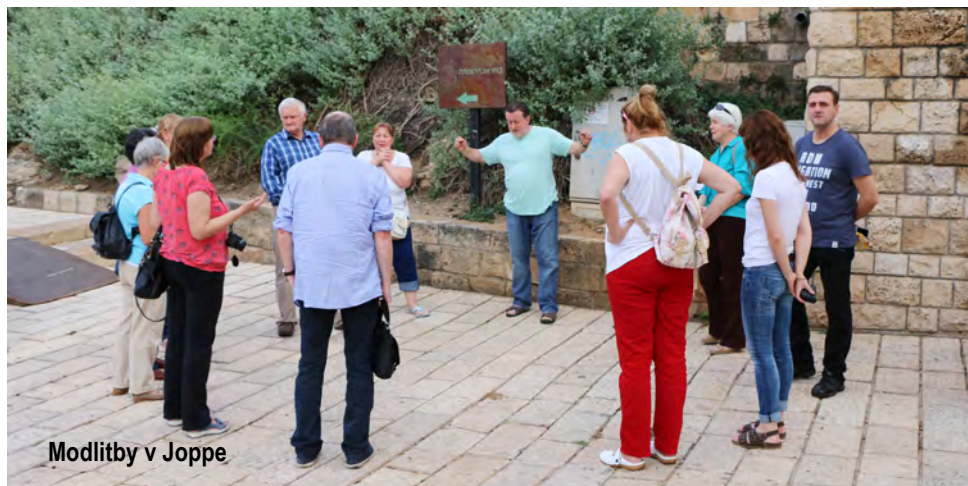
Modlitby v Joppe

vstupná brána – jediný prístav v tomto regióne. Podľa tohto miesta je nazvaná v Jeruzaléme Jaffská brána.