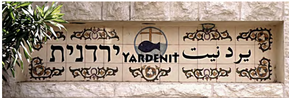
Krst v Jordáne (JARDENIT, IZRAEL)