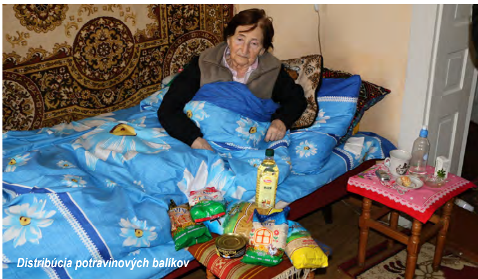
Distribúcia potravinových balíkov

Požehnanie začína dávaním a nie braním: príklad vdovy v chráme a príklad vdovy zo Sarepty Sidonskej. Jedna aj druhá dali v poslušnosti z toho posledného a to našlo priazeň v Božích očiach.