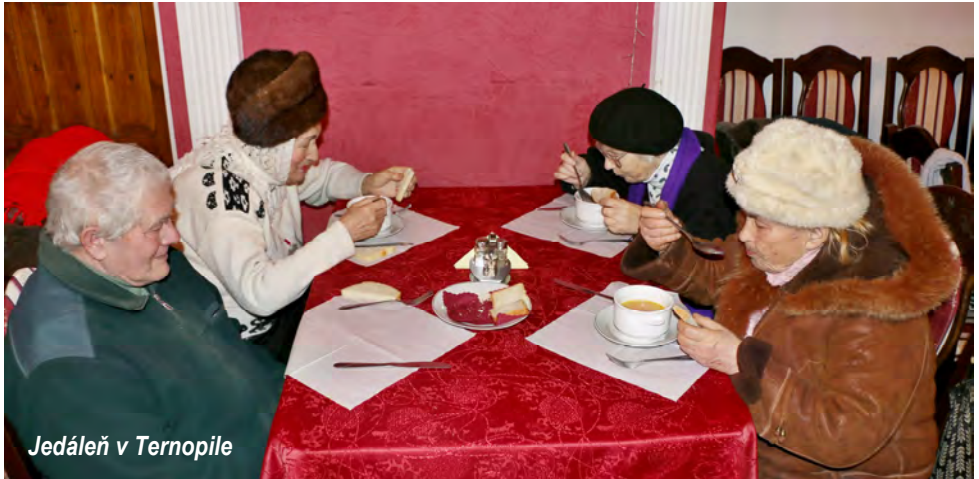
Jedáleň v Ternopile

Sme vďační Bohu za každého z Vás. Uvedomujeme si, že služba Židom pokračuje. Boh má svoje nástroje v slovenskom aj českom národe, ktoré povolal k požehnaniu svojho ľudu v Izraeli a diaspóre.