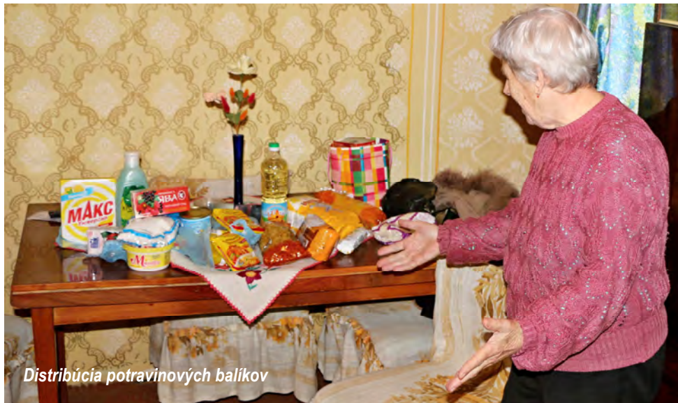
Distribúcia potravinových balíkov

a pamätať na slová Pána Ježiša, lebo On povedal: Blahoslavenejšie je dávať, ako brať“ (Sk. 20:35).