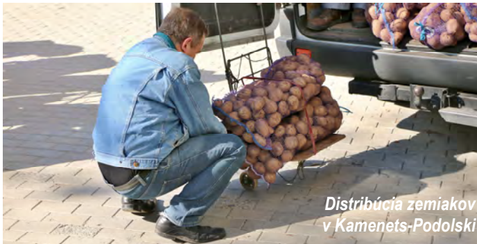
Distribúcia zemiakov v Kamenets-Podolski

Biblia hovorí, že „Ten, kto sa zmilúva nad chudobným, požičiava Hospodinovi, a on mu odplatí jeho dobrodenie“ (Pr.19:17). Zľutovať sa, neznamená len nejakú citovú záležitosť, ale odráža to náš praktický postoj ohľadne dávania financií, ktoré nám požehnal Pán. Boh nepotrebuje našu pomoc, ale my potrebujeme Jeho pomoc a Jeho požehnanie, aby sme naplnili Otcovu vôľu. Otcovo požehnanie prichádza, keď v poslušnosti vstupujeme do vecí, ktoré nám zjavuje, ktoré nám prikázal a do ktorých nás povolal.